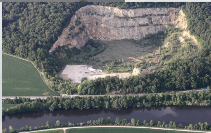
Der aufgelassene Steinbruch Greifenberg, ein vom Bund Naturschutz gerettetes Stück Kunst-Landschaft an der Jura-Naab. Heute ein artenreiches Biotop.

ersten Morgennebellicht. Drei dominante Quellflüsse (Haide-, Fichtel-, Waldnaab) speisen die Naab für ihren Weg über drei dominante geologische Schichten hinab zur Donauebene. Intakte Natur und historische Altstädte sowie immer wieder eindrucksvolle naturnahe Fluss- und Uferlandschaften zeigen sich aus ungewöhnlichen Blickwinkeln der Vogelperspektive. Gut 120 Jahre nach den ersten Pionierflügen unterlegen großformatige Luftbilder