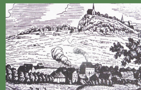
Der Gutshof Finkenhammer unter Pleystein: ehemals Hammerwerk, heute Biohof und Bäckerei

Diese Themenseite fördern zwei Traditionshöfe: