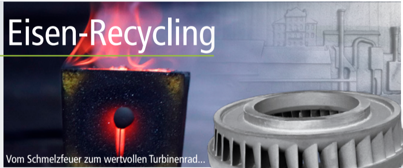
Vom Schmelzfeuer zum wertvollen Turbinenrad...

Die Eisenproduktion ist ein global konkurrierendes Geschäft und hart umkämpft. Eine ungleiche Klimapolitik (z.B. fällt für tschechische und polnische Gießereien keine CO2-Steuer an) benachteiligt deutsche Hütten, was zur Abwanderung von Kunden führt. Dennoch hat sich die Carolinenhütte mit ihren 67 Mitarbeitern eine stabile