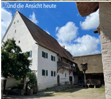
...Und die Ansicht heute

tiger Teil des großen Freilandmuseums. Eine Dauerausstellung zeigt das Leben und Arbeiten der ländlichen Bevölkerung in den vergangenen 300 Jahren. Der Hof ist aber auch zu einem Ort des Austau-