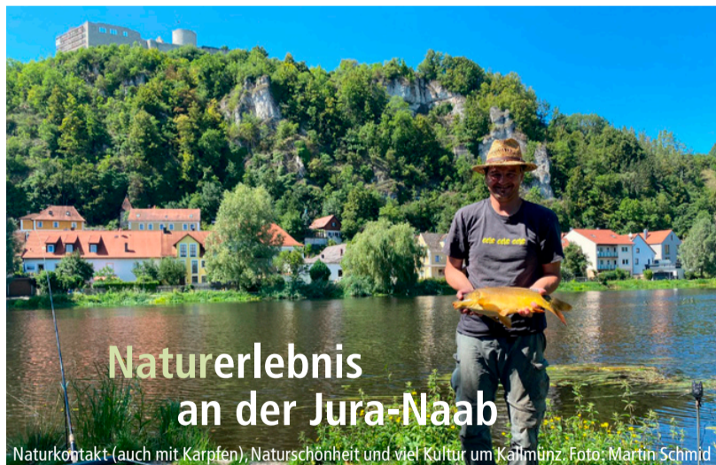
Naturerlebnis an der Jura-Naab

Naturkontakt (auch mit Karpfen), Naturschönheit und viel Kultur um Kallmünz.