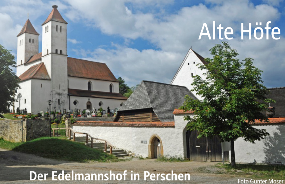
Der Edelmannshof in Perschen