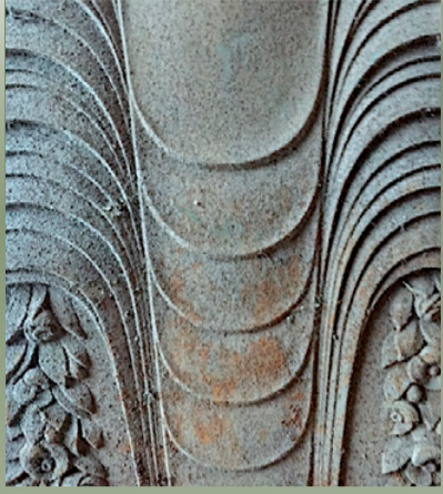
Langlebig, unverwüstlich schön trotz Rost: Gründerzeit-Eisengussrelief.

Die größte Kraft, die ein Mensch haben kann, ist die Stille Herbert Blomstedt