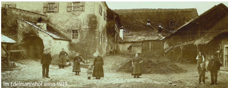
Im Edelmannshof anno 1919...

liefert: Ein Ensemble von höchstem kulturgeschichtlichem Wert. 1964 wurde hier das „Oberpfälzische Bauernmuseum Perschen“ eröffnet (siehe dazu die Kolumne rechts). Die Besucherzahlen stiegen bald – und auch der Aufwand. Um diese Dimensionen zu bewältigen, begann schliesslich die Suche nach einem öffentlichen Träger. 1976 wurde der Hof an den Bezirk Oberpfalz übergeben – und damit zur Keimzelle des heutigen Freilandmuseums Oberpfalz. Der Edelmannshof ist nach wie vor wich-